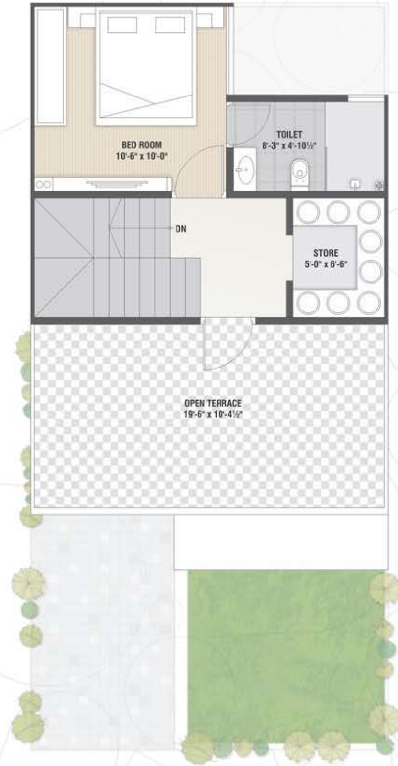
Second Floor Plan