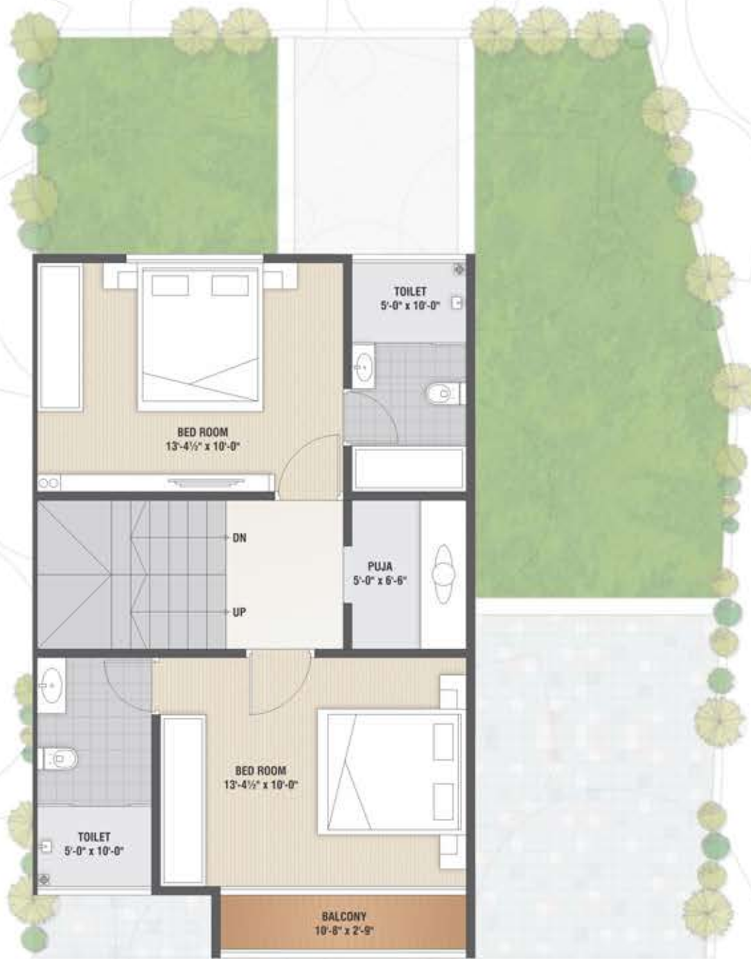
First Floor Plan