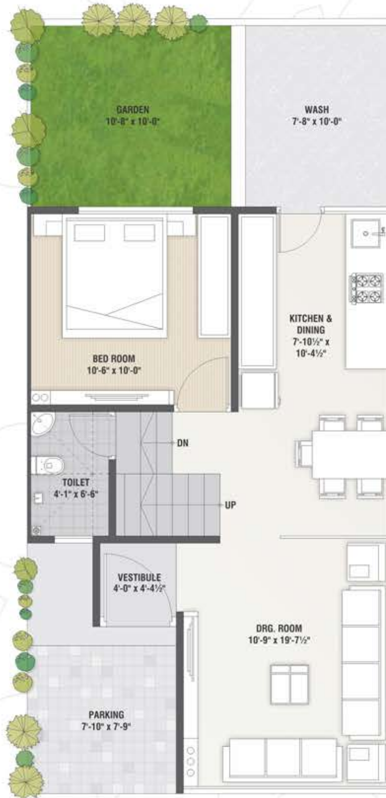
Ground Floor Plan