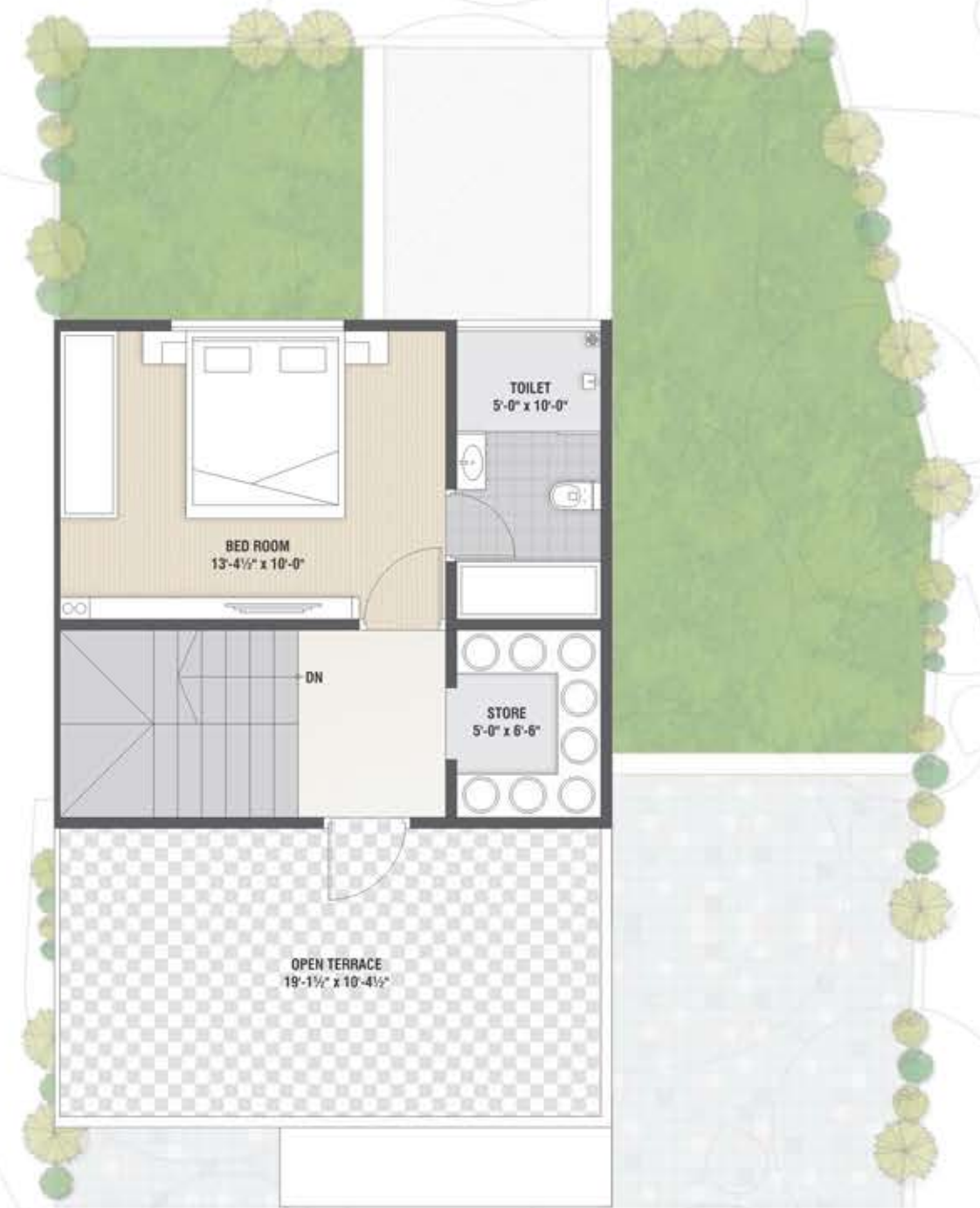
Second Floor Plan