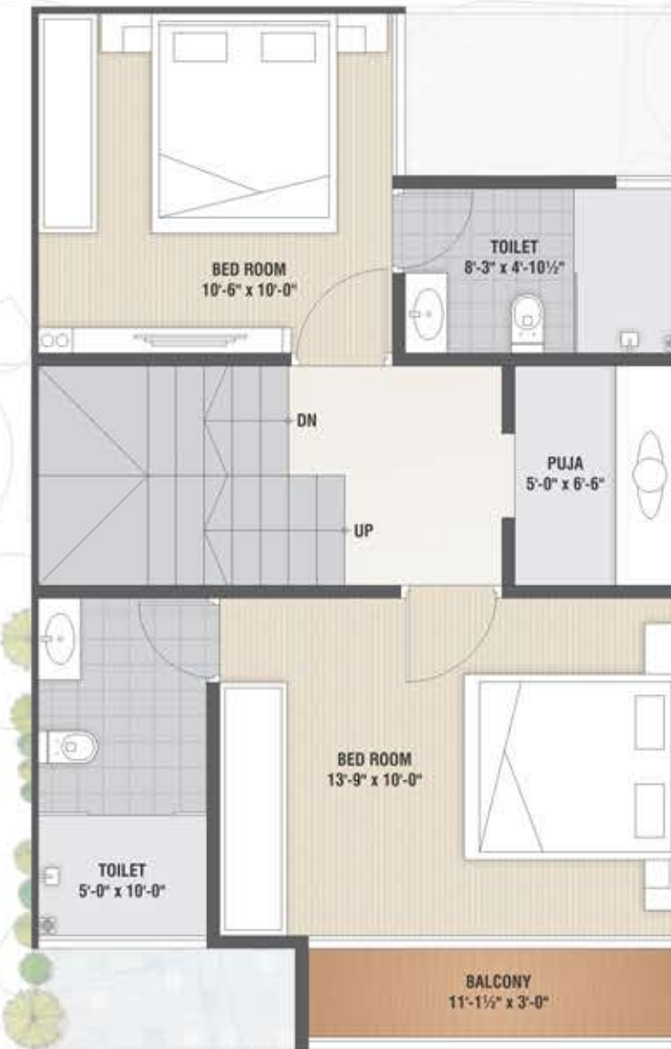
First Floor Plan