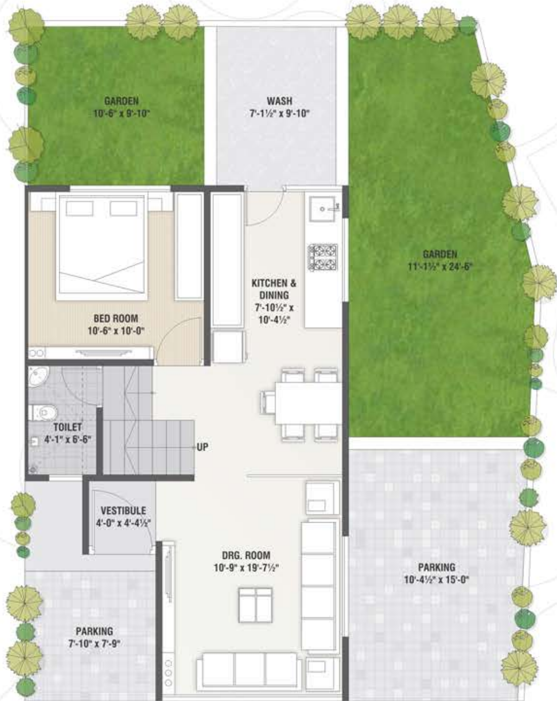
Ground Floor Plan