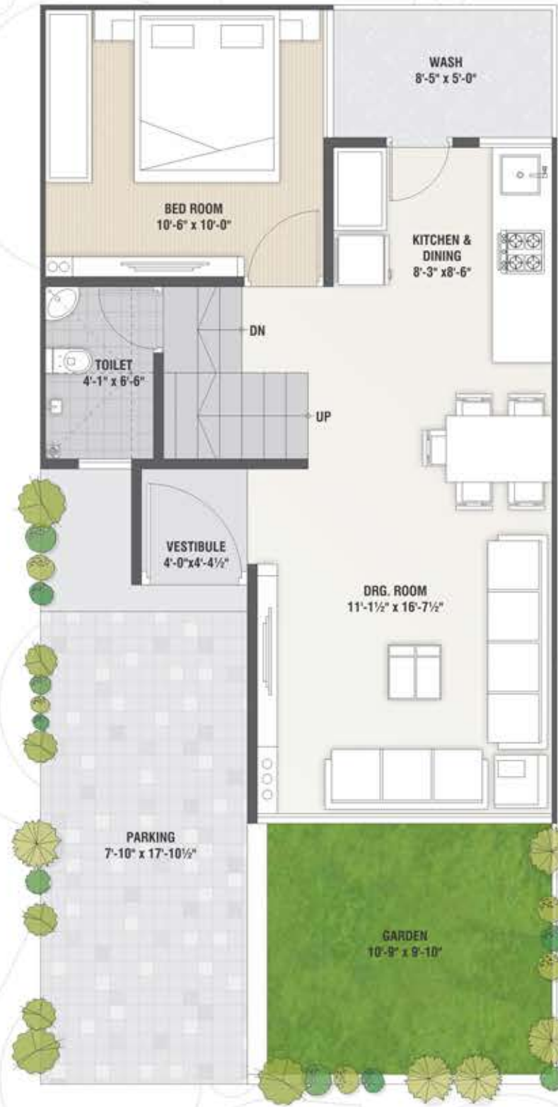
Ground Floor Plan