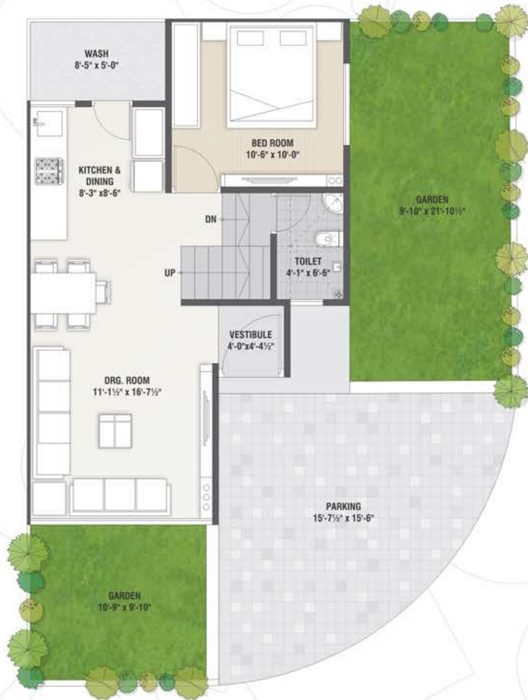
Ground Floor Plan