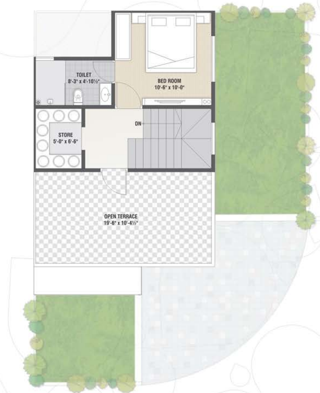
Second Floor Plan