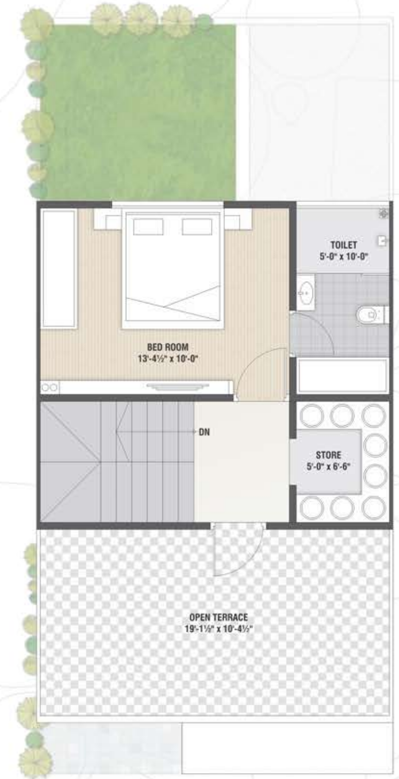
Second Floor Plan