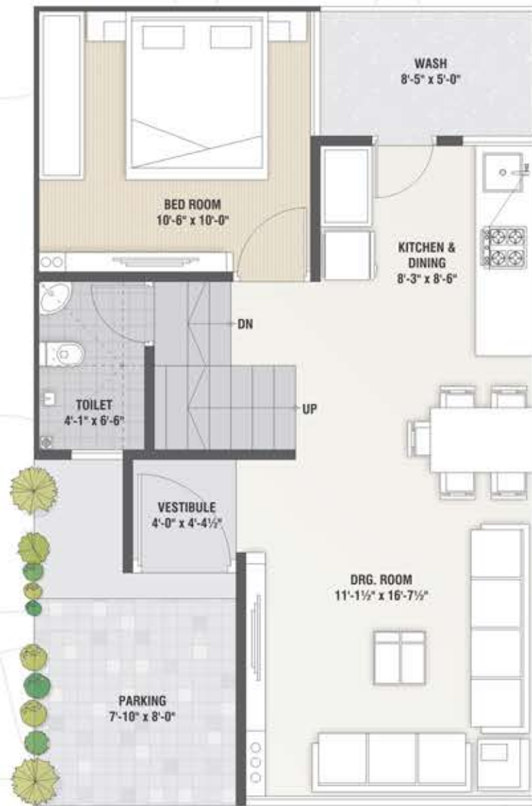
Ground Floor Plan