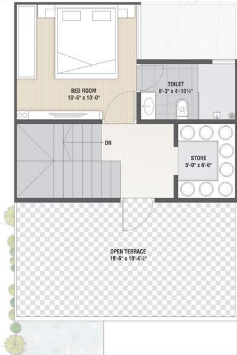
Second Floor Plan