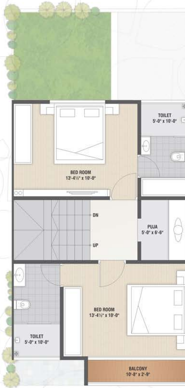
First Floor Plan