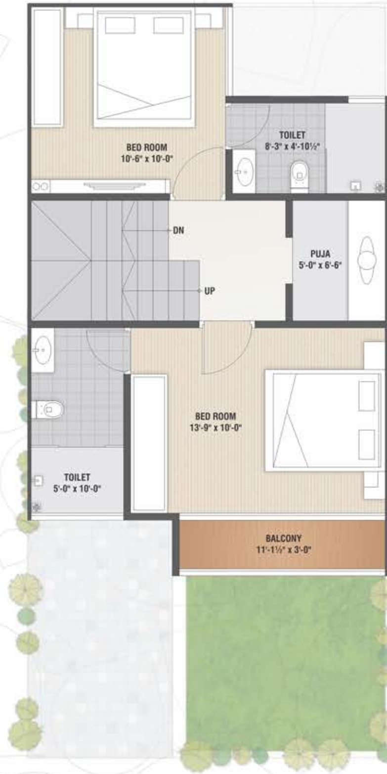
First Floor Plan