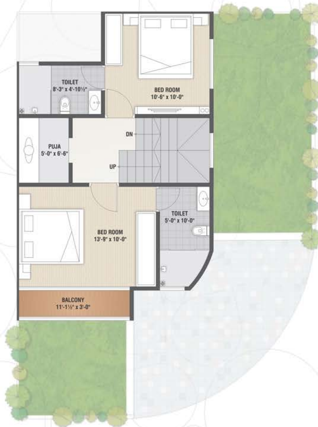
First Floor Plan